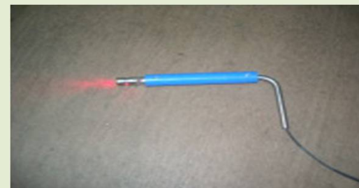
<液面センサ(標準品)>